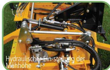
Hydraulischer Ein-stellung der Mähhöhe

GMR maskiner a/s Saturnvej 17 - DK 8700 Horsens